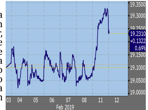
Movimiento USD/MXN últimos 7 días

Masari pone a disposición de sus clientes la compra de dólares en efectivo. Máximo $ 4,000 mensuales (compra mínima $ 1,000 USD).